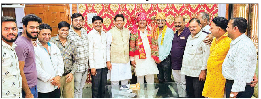
हरिभूमि न्यूज ▶▶आष्टा

हानि पहुंचने के साथ ही सामाजिक वातावरण भी प्रदूषित हो रहा है। इसके अलावा स्वयं और परिवार की सामाजिक स्थिति को भी भारी नुकसान पहुंचता है। वह नशे से अपराध की ओर अग्रसर हो जाता है और शांतिपूर्ण समाज के लिए अभिशाप बन जाता है। आज स्कूल, कॉलेज व गांवों में छोटे-छोटे कस्बों के बच्चों से लेकर बड़े-बुजुर्ग और विशेषकर युवा वर्ग बुरी तरह प्रभावित हो रहे हैं। इस अभिशाप से समय रहते मुक्ति पालने में ही मानव समाज की भलाई है। उन्होंने कहा कि आज कल अक्सर ये देखा जा रहा है कि युवा वर्ग इसकी चपेट में दिनों-दिन आ रहा है वह तरह-तरह के नशे जैसे- तम्बाकू, गुटखा, बीडी, सिगरेट और शराब के चंगुल में फंसता जा रहा है व इससे जुड़े काले धंधों में लिपट होकर जीवन बर्बाद कर रहा है। हमें इससे बचना चाहिए। इस दौरान नशा ना करने की शपथ दिलावाई।