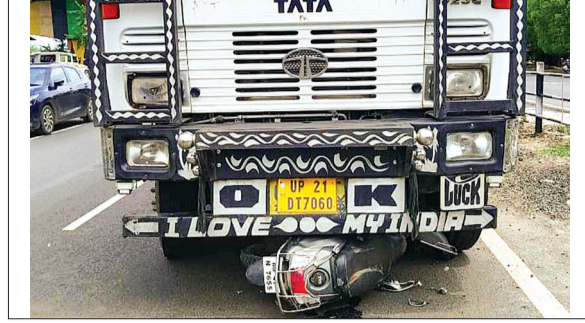
हरिभूमि न्यूज देवास