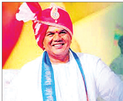
हरिभूमि न्यूज देवास