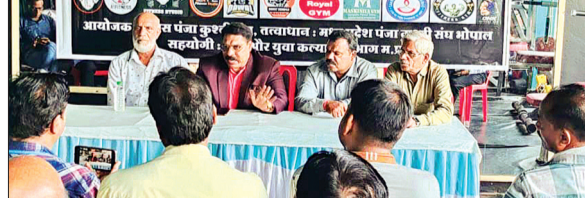
हरिभूमि न्यूज देवास

शहर में प्रथम बार राज्य स्तरीय ओपन आर्म रसलिंग (पंजा कुश्ती) प्रतियोगिता 30 जून रविवार को श्रीमंत तुकोजीराव पवार स्टेडियम भोपाल चौराहे पर आयोजित होने जा रहा है।